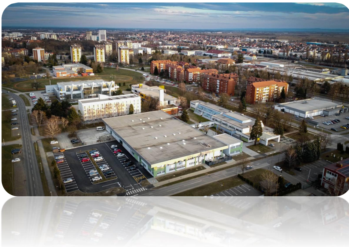
Slika 3. Tehnička škola Čakovec