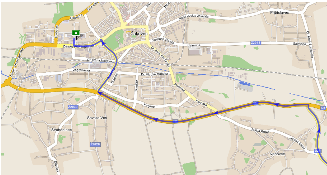
Slika 2. Karta grada Čakoveca (upute do škole)