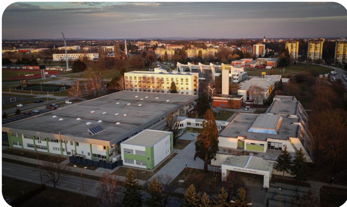
Slika 1. Pogled na zgrade i položaj Tehničke škole Čakovec

Malo je škola koje se mogu podičiti tradicijom obrazovanja i odgoja mladih u razdoblju koje prelazi 100 godina, a mi smo škola koja je 2020. obilježila 130. godinu postojanja.